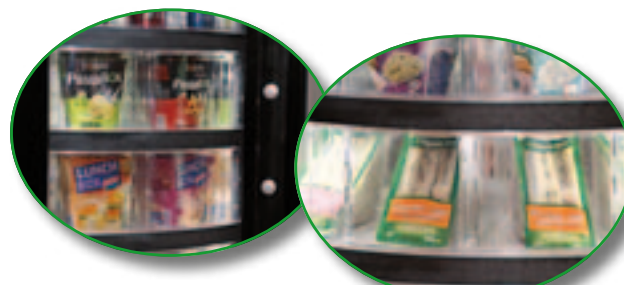
Evolution de la taille des portillons pour une distribution de produits plus volumineux